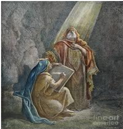
Baruch, de schrijver van Jeremia