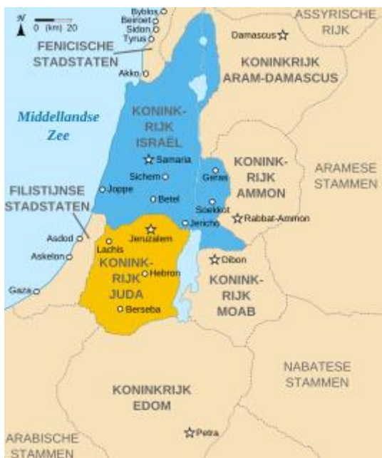
Israel en omgeving

26 aan Jeruzalem en de steden van Juda, zijn koningen en zijn vorsten, om die te maken tot een puinhoop, tot een verschrikking, tot een aanfluiting en tot een vloek, zoals het heden ten dage is, aan de farao, de koning van Egypte, zijn dienaren, zijn vorsten en heel zijn volk, aan alle mensen van allerlei herkomst en al de koningen van het land Uz, aan al de koningen van het land van de Filistijnen, aan Askelon, Gaza, Ekron en het overblijfsel van Asdod, aan Edom, Moab en de Ammonieten, aan al de koningen van Tyrus, al de koningen van Sidon, en de koningen van de kustlanden die liggen aan de overkant van de zee, aan Dedan, Tema, Buz, en allen die kaalgeschoren zijn aan hun slapen, aan al de koningen van Arabië en al de koningen van de gemengde bevolking die in de woestijn woont, aan al de koningen van Zimri, al de koningen van Elam en al de koningen van Medië, aan al de koningen van het noorden, die dichtbij en veraf zijn, de een na de ander; ja, aan al de koninkrijken van de aarde, die op de aardbodem zijn. Na hen zal de koning van Sesach drinken. Feitelijk zijn het de buurvolken die zich ten westen en ten oosten van Juda en Jeruzalem bevinden - genoemd van zuid naar noord. En tenslotte het volk ten noorden van Juda en Jeruzalem: Babel.