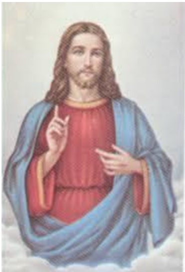
Gered door de Heere Jezus