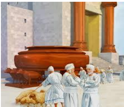
De tempelprediking van Jeremia.