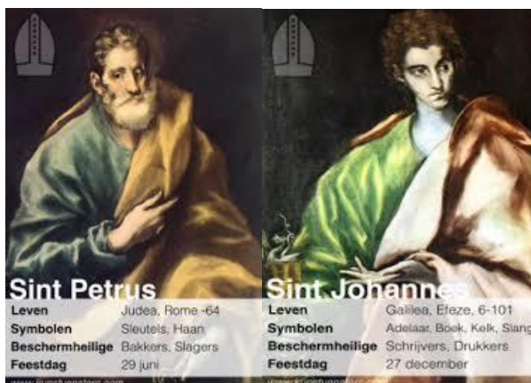
Petrus en Johannes