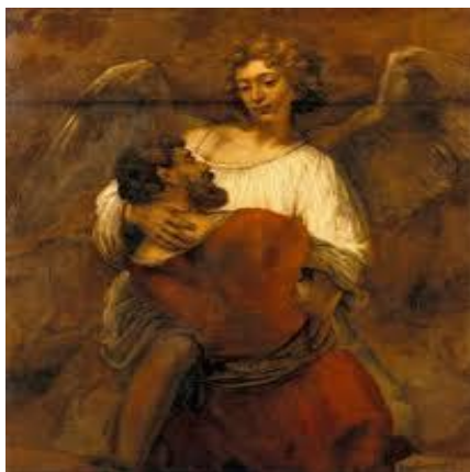
Jakob vecht met de engel (Rembrandt van Rijn)