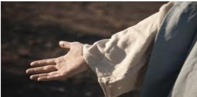
Gods uitgestoken hand

hoogten, een gewezen, smeekbeden door de Israëlieten, want zij hebben hun weg krom gemaakt, zij hebben de HEERE, hun God, vergeten. Keer terug, afkerige kinderen, Ik zal u van uw afdwalingen genezen. Zie, hier zijn wij. Wij komen tot U, want U bent de HEERE, onze God. God steekt Zijn hand naar hun uit. Ze grijpen die uitgestoken hand van God met beide handen aan. Ze kunnen dankzij Gods genade oprecht bij Hem terugkomen en Hem erkennen als hun God en HEERE. Maar dat niet alleen. Ze krijgen dankzij Gods genade en kracht ook een nieuw vertrouwen in God en – daar komt nog iets bij – een nieuwe gehoorzaamheid. Ze zien nu ook in dat ze uitgekleet werden door de afgoden die ze achterna liepen. Ze zeggen in Jeremia 3:23-25 Voorwaar, tevergeefs verwacht men het van de heuvels, en de menigte van de bergen. Voorwaar, in de HEERE, onze God, is het heil van Israël. Die schande heeft de arbeid van onze vadersen verslonden, van onze jeugd af, hun schapen en hun runderen, hun zonen en hun dochters. Wij liggen in onze schande en onze smaad overdekt ons, want tegen de HEERE, onze God, hebben wij gezondigd, wij en onze vadersen, van onze jeugd af tot op deze dag, wij hebben niet geluisterd naar de stem van de HEERE, onze God. Deze mensen hebben oprecht spijt maar ook inzicht in wat er fout ging. Ze weten nu heel goed wat ze moeten doen en wat niet.