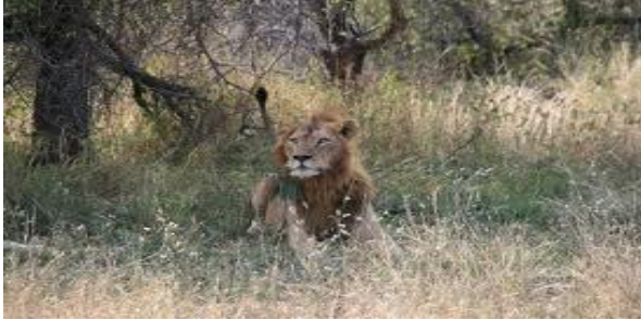
Zoals een leeuw uit het struikgewas springt