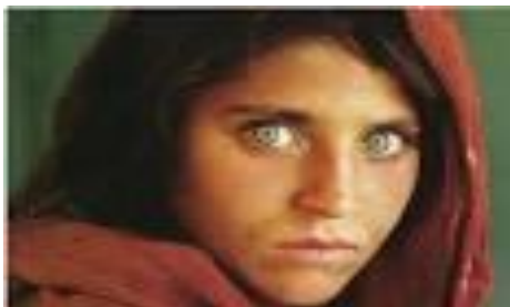
de dochter van Sion