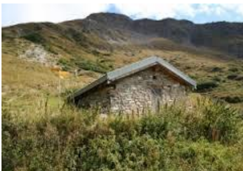
Ach, had ik maar een nachtverblijf in de woestijn.

Jeremia is verdrietig. Het lot van zijn volk gaat hem erg aan het hart. Jeremia 1:1 Och, was mijn hoofd maar water en mijn oog een bron van tranen, ik zou dag en nacht wenen over de gesneuvelden bij de dochter van mijn volk. Het lijkt erop dat de Heere reageert op het verdriet van de profeet. De HEERE zegt: ‘Ik kan eigenlijk niemand meer vertrouwen. De mensen menen niet wat ze zeggen. Ze liegen de hele boel aan elkaar.’ De HEERE wordt er onpasselijk van. Het liefst zou de HEERE niemand, maar dan ook helemaal niemand meer tegenkomen. God wil zich terugtrekken ergens op een eenzame berg in een hut; een zogenaamde chan . Jeremia 9:2,3 Och, had ik in de woestijn maar een kamp voor reizigers! Ik zou mijn volk verlaten, ik zou bij hen weggaan, want zij zijn allen overspelers, een trouweloos gezelschap. Zij spannen hun tong als hun boog. Met leugen en niet met betrouwbaarheid zijn zij in het land sterk geworden, want zij gaan voort van slechtheid tot slechtheid, en Mij kennen ze niet, spreekt de HEERE.