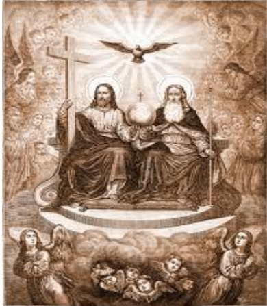
God de Vader, God de Zoon en God de Heilige Geest.