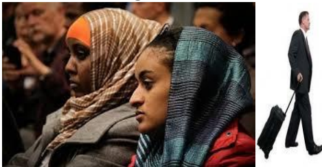
een vreemdeling in dit land, een reiziger