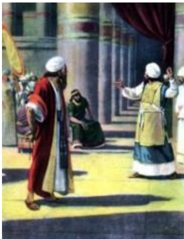
Confrontatie met valse profeet en Jeremia.