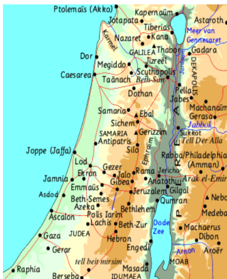
Deze mensen komen uit Sichem, Samaria en Silo.

Het is zo slecht wat er in Mizpa gebeurt en dat terwijl er aan de horizon mooie zaken dichterbij komen. Maar toen was het leed al geschied. Gedalia was al dood. Het was 'the day after'. Niemand wist het nog. Ook de stoet pelgrims die de stad naderde was volstrekt onbekend met de nieuwe feiten. Jeremia 41:4,5 Het gebeurde op de tweede dag, nadat hij Gedalia ter dood gebracht had – en niemand wist het nog – dat er mannen uit Sichem, uit Silo en uit Samaria aankwamen.