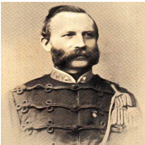
Gedalia, de gouverneur van Juda

In de vierde maand van 586 v Chr. was Jeruzalem gevallen. Jeremia 39:2 In de vijfde maand had Nebuzaradan Jeremia van zijn boeien ontdaan. Jeremia 40:4 Nu dan, zie, ik heb u vandaag losgemaakt van de ketenen die om uw handen waren. Als het goed is in uw ogen om met mij naar Babel te komen, kom mee, en ik zal mijn oog op u gericht houden. Maar is het kwalijk in uw ogen om met mij mee naar Babel te komen, laat het. Zie, heel het land ligt vóór u: Ga daarheen, waar het in uw ogen goed en juist is te gaan. Jeremia was vrij om te gaan en te staan waar hij wilde. Hij koos ervoor om naar Gedalia te gaan die zich in Mizpa had gevestigd. Deze Gedalia behoorde tot de schrijversfamilie Safan die Jeremia altijd goed gezind was geweest. Zijn vader Ahikam had Jeremia nog behoed voor een lynchpartij op het tempelplein. Jeremia 26:24 Maar de hand van Ahikam, de zoon van Safan, was met Jeremia, zodat men hem niet overgaf in de hand van het volk om hem ter dood te brengen. Deze Gedalia was door koning Nebukadrezar aangesteld als gouverneur van wat er van Juda en Jeruzalem over was.