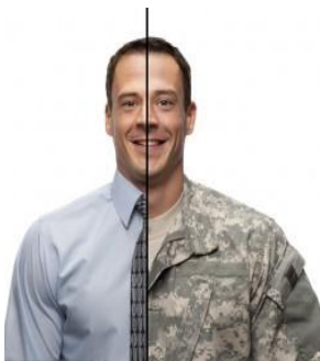
Johanen, de zoon van Kareah