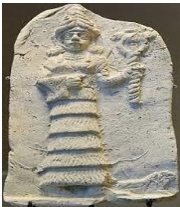
Ishtar, koningin van de hemel

Voor vrouwen is de tijd voorafgaande aan het oordeel vooral ook een lastige tijd omdat ze het gevoel kunnen hebben van: 'Nu krijgen wij als vrouwen eindelijk wat meer ruimte. Nu mogen we uitstappen