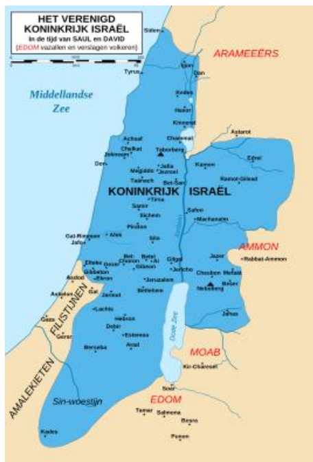
Het koninkrijk van David