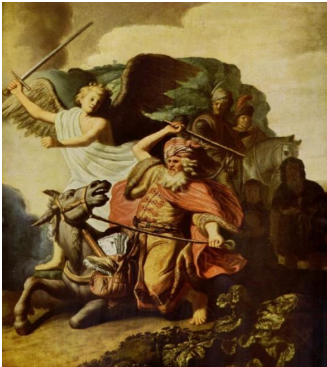
De ezel die Bileam wilde stoppen. (Rembrandt van Rijn)

Het gebied van Moab (..) wordt verdeeld onder de stam van Ruben en Gad en de halve stam Manasse. Na de verovering van het land Kanaän wordt het gebied van de Moabieten en Amorieten en