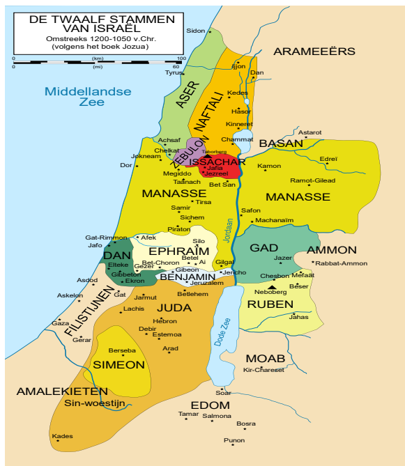
Het gebied van Ruben, Gad en Manasse