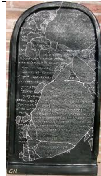
De Mesa Stele

van Moab heeft met hulp van de Ammonieten en de Amelekieten gedurende de Richterentijd 18 jaar lang het volk Israël onderdrukt. Dankzij de rechter Ehud maakte de HEERE een eind aan die overheersing. Rechters 3:29,30 En in die tijd versloegen zij de Moabieten, ongeveer tienduizend man, allemaal welgedane en strijdbare mannen, zodat niet één man ontkwam. Zo werd Moab op die dag onder de hand van Israël vernederd. En het land had tachtig jaar rust. In de tijd van Jefta stak oud zeer opnieuw de kop op. De koning van Ammon verweet de Israëlieten dat zij bij de intocht het land hadden veroverd. Jefta zag dit heel anders, maar toch liep het uit op een confrontatie met de Ammonieten. In de discussie tussen Jefta en de koning van Ammon komen ook de Moabieten nog voorbij. Rechters 11:25,26 Welnu, bent u zoveel beter dan Balak, de zoon van Zippor, de koning van Moab? Heeft hij het ooit tegen Israël opgenomen? Heeft hij ooit tegen hen gestreden? En dat terwijl Israël driehonderd jaar in Hesbon en de bijbehorende plaatsen heeft gewoond, en in Aroër en de bijbehorende plaatsen, en in al de steden die aan de oevers van de Arnon liggen. Waarom hebt u die dan al die tijd niet bevrijd? Met succes slaat Jefta de aanval van de Ammonieten af. Opnieuw breekt een tijd van rust aan voor de stammen in het over Jordaanse land.