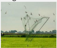
Het vangnet en de

Kerioth wordt ingenomen, de bergvestingen veroverd, het hart van Moabs helden zal op die dag zijn als het hart van een vrouw in barensood