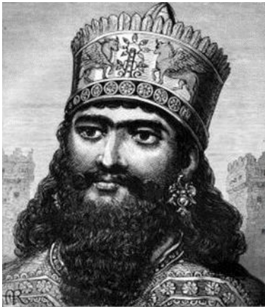
Nebukadrezar, de koning van Babel.