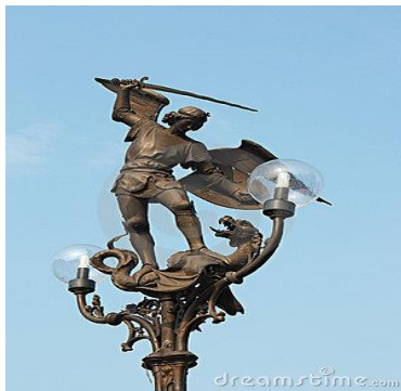
Joris en de draak