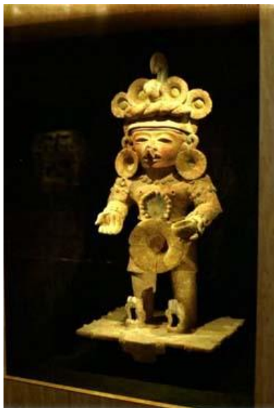
Zijn gegoten beeld is immers bedrog: er zit in hen geen adem.

Alle volkeren worden door de HEERE tegen Babel opgezet.