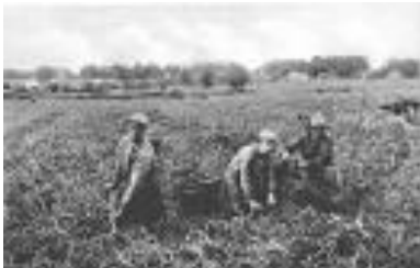
Wij worden op onze nek gezeten; wij zijn doodmoe, maar rust gunt men ons niet!