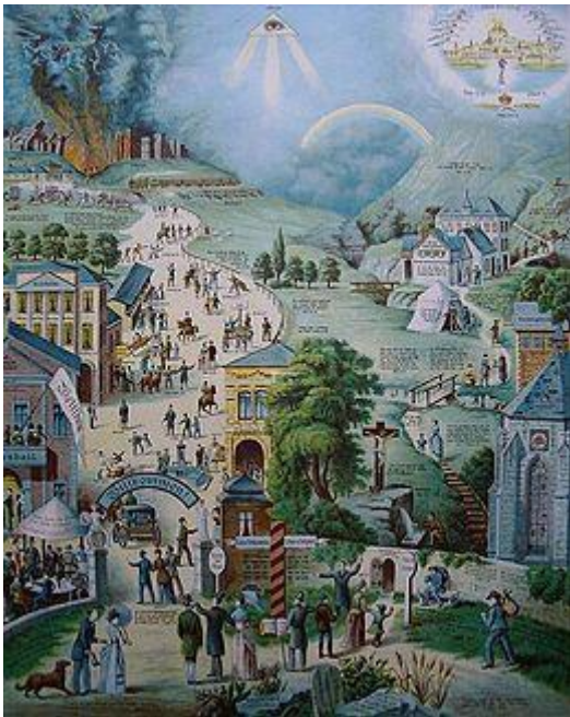
Ga binnen door de nauwe poort.

Helemaal afhankelijk van Gods genade, al is de eigen verantwoordelijkheid daarbij inbegrepen: Paulus. Hoewel we bij de Heere Jezus onze positie innemen bij de laatste ernst van de uitverkiezing, wekt de apostel Paulus de indruk dat hij ook persoonlijk op zijn qui-vive moet blijven. Het is – voor het gevoel van