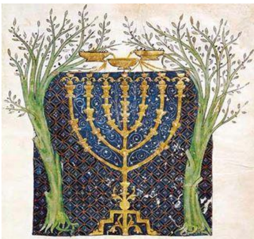
Naast de lampenstandaard staan twee olijfbomen.