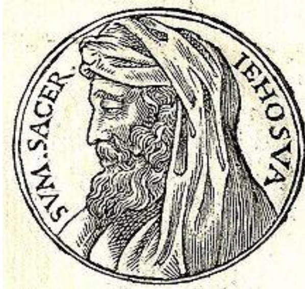
De hogepriester Jozua