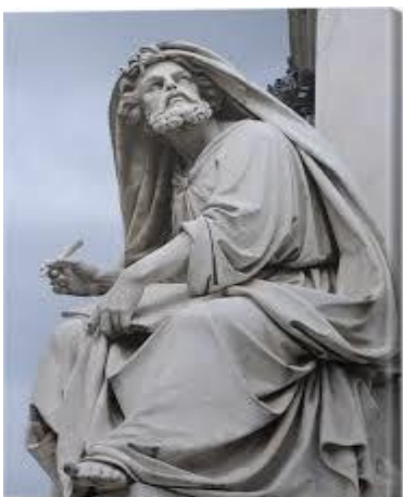
Standbeeld van Jesaja in Rome