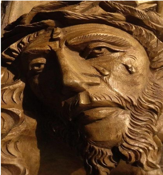
De lijdende knecht van de HEERE

Jesaja 53:1-12 Wie heeft onze prediking geloofd, en aan wie is de arm van de HEERE geopenbaard? Want Hij is als een loot opgeschoten voor Zijn aangezicht, als een wortel uit dorre aarde. Gestalte of glorie had Hij niet; als wij Hem aanzagen, was er geen gedaante dat wij Hem begeerd zouden hebben. (..) Maar Hij is om onze overtredingen verwond, om onze ongerechtigheden verbrijzeld. De straf die ons de vrede aanbrengt, was op Hem, en door Zijn striemen is er voor ons genezing gekomen. (..) Als een lam werd Hij ter slachting geleid; als een schaap dat stom is voor zijn scheerders, zo deed Hij Zijn mond niet open. (..) Men heeft Zijn graf bij de goddelozen gesteld, en Hij is bij de rijke in Zijn dood geweest, omdat Hij geen onrecht gedaan heeft en geen bedrog in Zijn mond geweest is. (..) Door de kennis van Hem zal de Rechtvaardige, Mijn Knecht, velen rechtvaardig maken, want Hij zal hun ongerechtigheden dragen. (..)