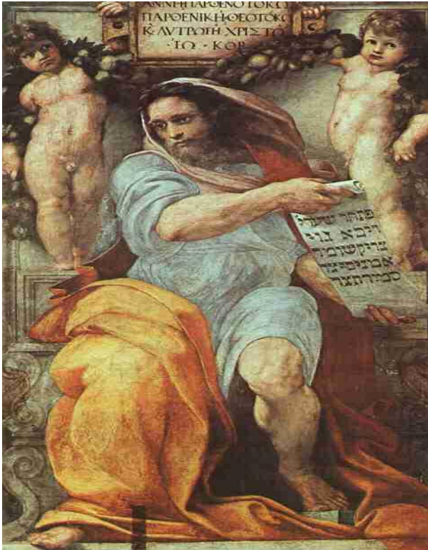
De profeet Jesaja en zijn zonen.

Jeruzalem die zich bekeerd heeft tot de God van Israel – de zogenaamde rest – en de vijanden van Israel proberen zoveel mogelijk buit te maken in Juda en Jeruzalem, maar ze zullen – alweer volgens de God van de profeet Jesaja – zelf geplunderd worden en uiteindelijk bakzeil halen. Die jongens zijn niet alleen tekenen , maar ook wonderen van Gods kant, aangezien ze van te voren haarfijn vertelden hoe het zou verder gaan met het volk in Jeruzalem en Juda en met hun tegenstanders. Het moet als een lopend vuurtje door de stad gaan. Nee, het is zeker niet onbekend waar de profeet is en wie de profeet is en hoe de God van de profeet over de ontwikkelingen oordeelt. Jesaja 8:18 Zie, ik en de kinderen die de HEERE mij gegeven heeft, dienen tot tekenen en wonderen in Israël, afkomstig van de HEERE van de legermachten, Die op de berg Sion woont.