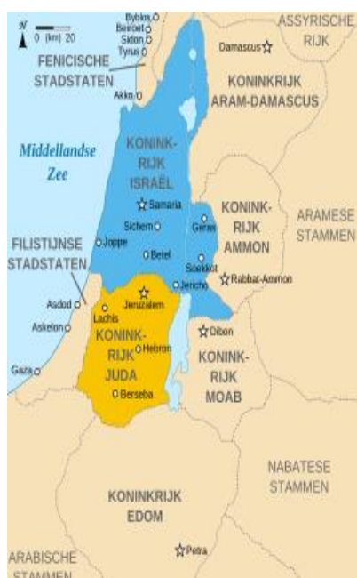
De Syrisch-Efraïmitische oorlog