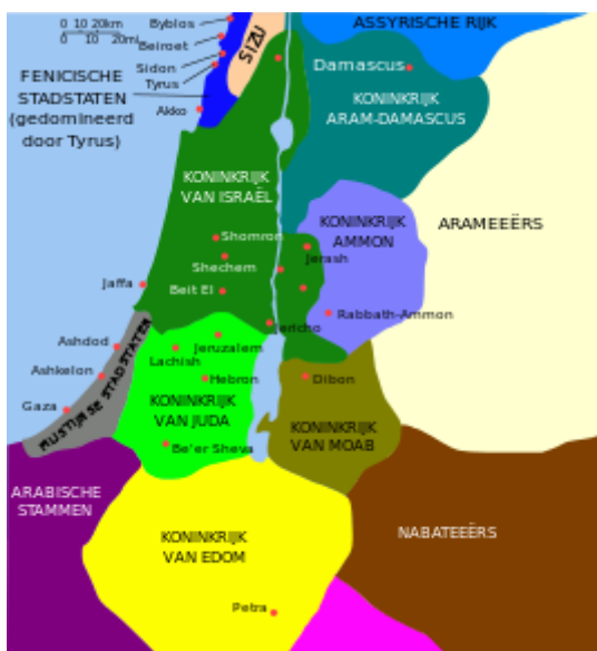
Het Koninkrijk van (Noord) Israel en van Syrië