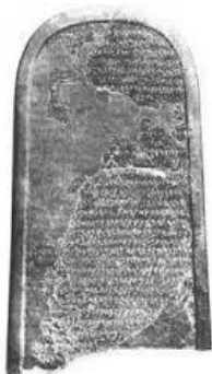
Een inscriptie van koning Mesha van Moab uit de 9 de eeuw v Chr.