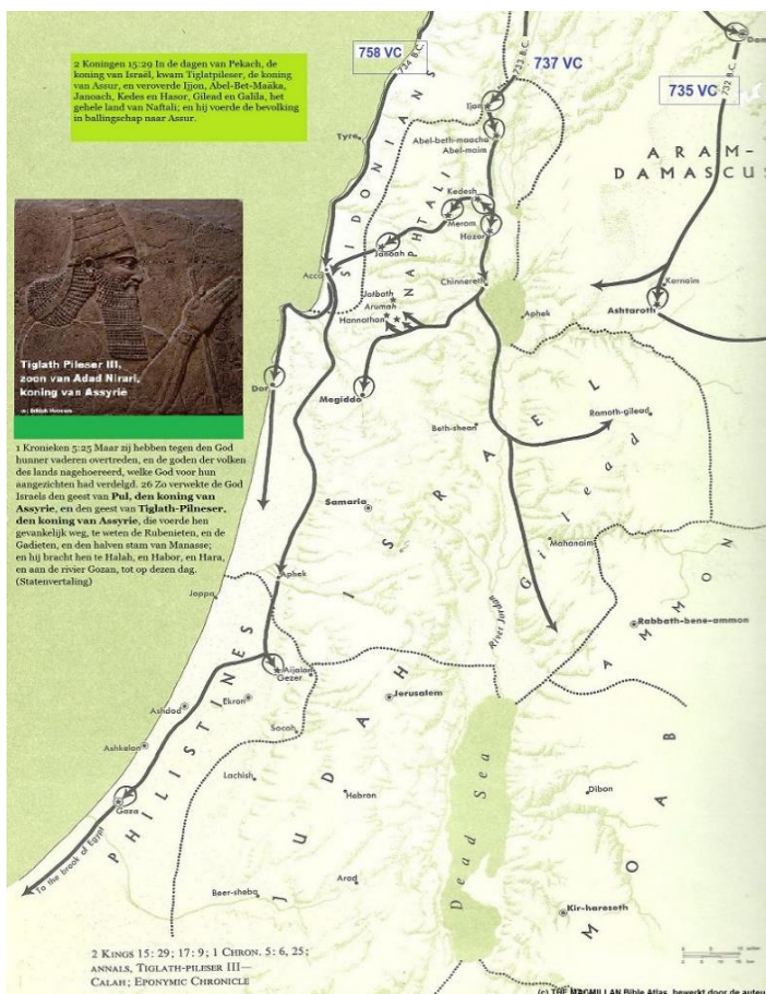
De aanval van Tiglat Pileser III

landen als Syrië en Israel zich voor die tijd bevonden – die luister lijkt nu wel voorgoed tot het verleden te behoren. De versterkte steden zijn voor een belangrijk deel verwoest en de bevolking is ook voor belangrijk een deel – in de zin van de gegoede burgerij – weggevoerd naar Assur. Daarna kalfte – wat eens een welvarend gebied was – zienderogen af. Jesaja 17:3 Dan zal de vesting uit Efraïm weggedaan worden, en het koninkrijk uit Damascus, en ook het overblijfsel van de Syriërs zal verdwijnen. Het zal hun vergaan als de luister van de Israëlieten, spreekt de HEERE van de legermachten. Feitelijk spelen deze zaken zich af in de tweede helft van de zevende eeuw. Damascus valt in 732 v Chr. Samaria volgt 10 jaar later in 722 v Chr. Was het gebied aanvankelijk onrustig vanwege de strooptochten van Syrië en Samaria – gericht tegen de koninkrijk van Juda – later waren het de bijna jaarlijkse veldtochten waarmee Assur zijn wil oplegde aan de zuidelijke staten. Het mag duidelijk zijn dat de profeet Jesaja opereerde vanuit Jeruzalem. Omdat koning Achaz zich weinig gelegen liet liggen aan de woorden van de HEERE was het een extra spannende tijd voor Jeruzalem en Juda met veel ongeregelheden in hun achtertuin.