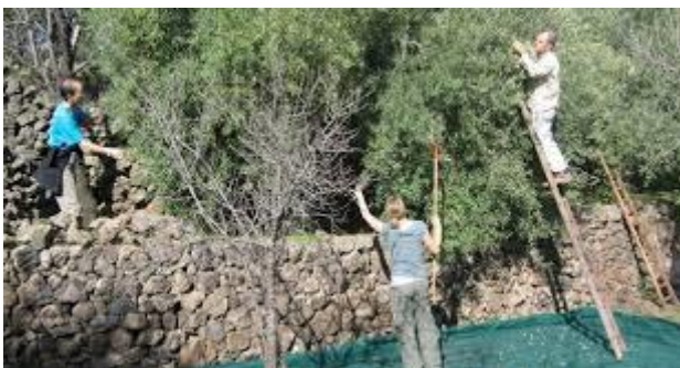
Olijvenogst als metafoor voor ‘de rest’.