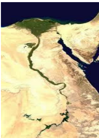
Boven en beneden (=Delta) Egypte