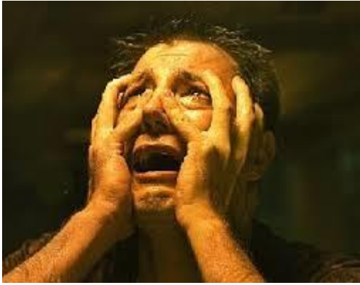
De profeet Jesaja is geschokt door wat hij te horen krijgt