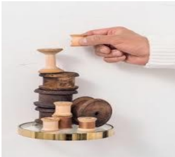
Hoogmoed komt voor de val