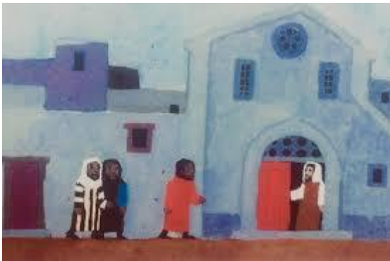
In huis bij de profeet Ezechiël.