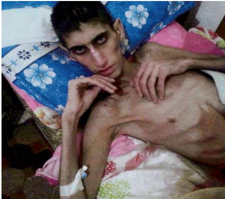
Mensenkind, zie, Ik laat het in Jeruzalem aan brood ontbreken.

voor een groot deel uit de resten van stro en gras en bladeren, in ieder geval organisch materiaal. Maar mensen eten dieren. Hoe kan Ezechiël weten wat de mensen allemaal gegeten hebben waarvan hij de opgedroogde poep verbrandt. Misschien hebben ze wel van een dier gegeten dat al dood was, of verscheurd of gegeten van vlees van een onrein dier. In dat geval zou het Ezechiël zich verontreinigen. En dat terwijl hij als priester vanaf zijn jeugd zo zijn best gedaan heeft om zich aan de reinheidsvoorschriften te houden. Ezechiël 4:14 Toen zei ik: Ach, Heere HEERE, zie, mijn ziel is nooit verontreinigd, omdat ik van mijn jeugd af tot nu toe geen kadaver of wat verscheurd is, gegeten heb. Er is geen onrein vlees in mijn mond gekomen. Gelukkig – voor Ezechiël – was de HEERE niet ongevoelig voor dit verzoek. God komt de profeet op dit punt tegemoet. Hij mag zijn brood bakken op mest van dieren. Ezechiël 4:15 Daarop zei Hij tegen mij: Zie, Ik geef u rundermest in plaats van menselijke uitwerpselen. Bereid daarop uw brood. De symboolwaarde van onreinheid blijft vermoedelijk gelijk.