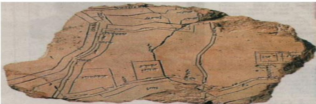
BEELD 1: JERUZALEM BELEGERD