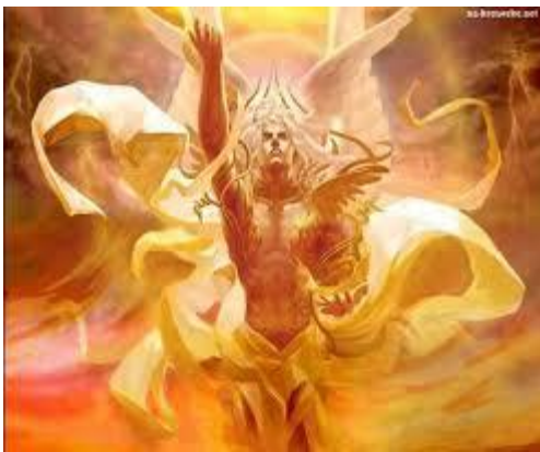
Gods verschijning gaat gepaard met vuur.