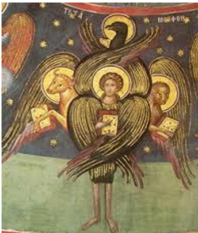
Elke cherub heeft vier gezichten.