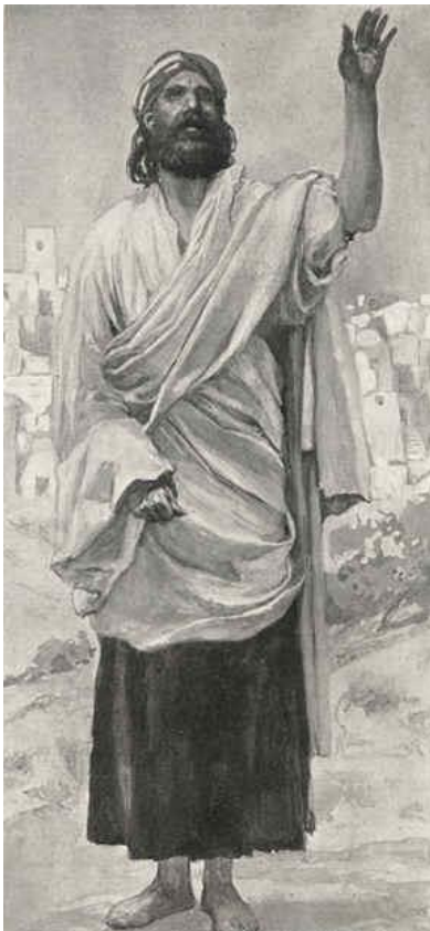
De Man gekleed in linnen.