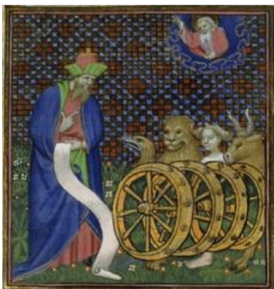
Iedere cherub had vier gezichten.