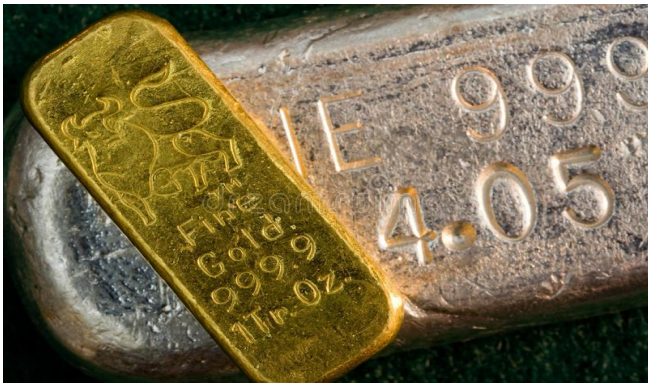
Goud en zilver kun je niet eten.

toe. Daarmee heeft het volk de HEERE op het hart getrapt. Ezechiël 7:20 De pracht van Zijn sieraad heeft Hij tot iets voortreffelijks gesteld, maar zij hebben er beelden van hun gruweldaden en van hun afschuwelijke afgoden van gemaakt. Daarom heb Ik dat voor hen tot een voorwerp van onreinheid gemaakt. De vijand heeft de tempel geplunderd voordat ze hem in de brand hebben gestoken. Al het goud en zilver en koper en brons is naar Babel vervoerd. God had er helemaal geen plezier meer in. Ze mochten het meenemen. Ezechiël 7:21 Ik zal het als prooi in de hand van de vreemden geven, en als buit aan de goddelozen van de aarde, zodat zij het ontheiligen zullen. De HEERE heeft het tot een voorwerp van onreinheid gemaakt. Hij heeft het ontheilgd door de vijand de toegang te geven tot Zijn huis. Ze mochten de hele handel meenemen. De mensen riepen ‘ach en wee’. Ze hielden tranen met tuiten, toen de tempel werd geplunderd en de vijand het heilige der heiligen binnenging. Ezechiël 7:22 Ik zal Mijn aangezicht van hen afwenden, en zij zullen Mijn verborgen plaats ontheiligen: gewelddadigen zullen er binnenkomen en die ontheiligen. Het waren krokodillentranen. Waar was de eer die God van Zijn eigen volk mocht verwachten. Waar was hun dienst? Waar was hun toewijding? Die ging voor het grootste gedeelte naar andere goden.