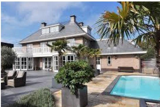
Koophuizen in de rijke buurt in Jeruzalem.