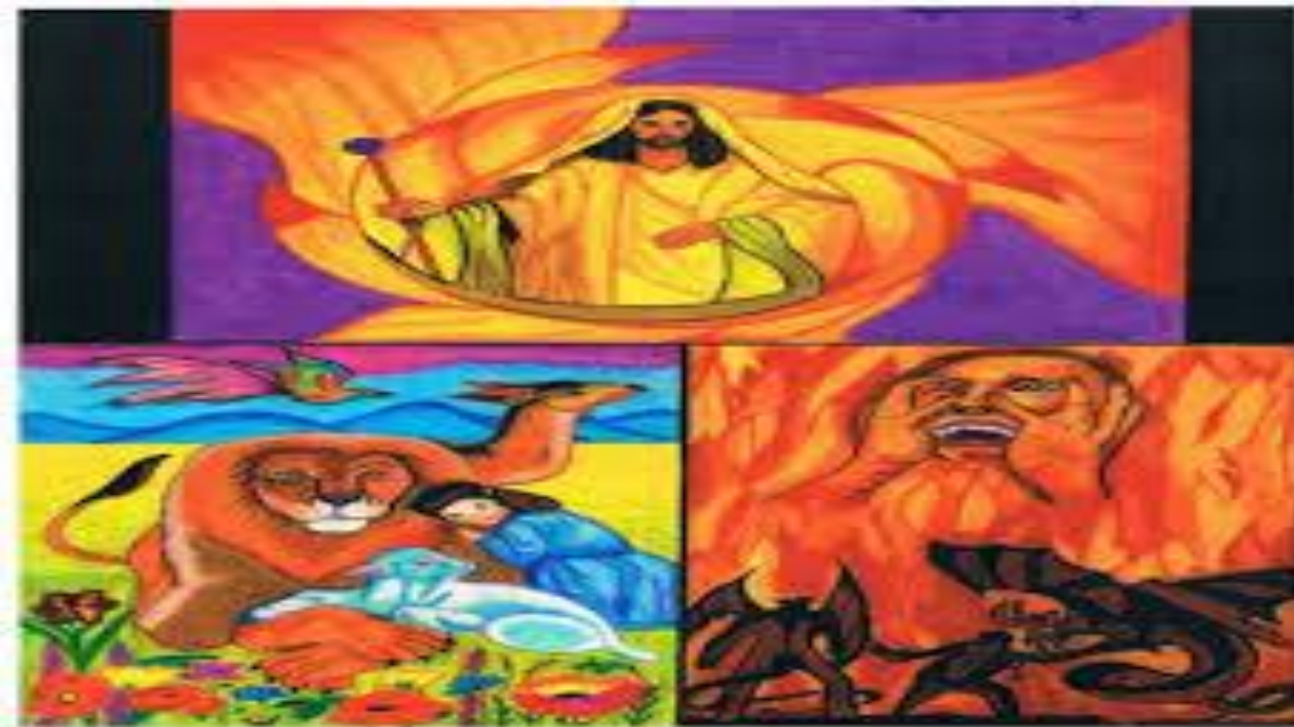
De dag van de HEERE in het Nieuwe Testament.