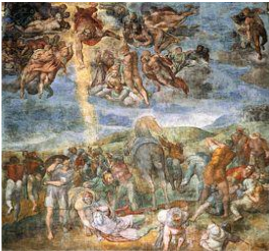
De roeping van Paulus. (Michelangelo)

Van het ene op het andere moment was Paulus er van overtuigd dat Jezus Gods Zoon, dwz dat Jezus God was. Handelingen 9:20 En meteen predikte hij Christus in de synagogen, dat Hij de Zoon van God is. De Romeinse keizer werd ook Kurios genoemd. Hoeveel christenen hebben hun leven niet verloren toen ze antwoord moesten geven op de vraag wie voor hen de Kurios was, Jezus of de keizer? Ze hebben hun leven in zekere zin verloren, maar feitelijk hebben ze hun leven gewonnen, want Jezus is Heere. Hij gaat over dood en leven. De eeuwige dood en het eeuwige leven zijn in Zijn hand. Voor de Heere was het een hele klus om Paulus op andere gedachten te brengen. Hij was aanvankelijk namelijk een fervent tegenstander van Jezus en het Evangelie. ‘Dit was precies zoals het niet moest’, meende Paulus, die toen overigens nog Saulus heette. Je kon hem niet gauw kwaad krijgen, maar de rook kwam uit zijn oren als