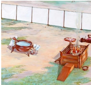
Toen kwamen zij binnen en gingen naast het koperen altaar staan.

lezen we het getal zeven. Het is de vraag of je van een groep kunt spreken als zes leden van de groep een heel andere opdracht hebben, dan die ene Man. Iemand zal er op wijzen dat de HEERE bij het oordeel de schapen van de bokken scheidt. Voor sommigen vormt de beslissing van de HEERE de toegang tot het eeuwige leven voor anderen is het de weg naar de uitgang, een weg naar de eeuwige dood. In zekere zin passen de zeven – zowel de zes als die ene – in Gods plan ten goede en ten kwade, maar in Ezechiël wordt de Man in linnen afgezonderd van de andere zes al staan ze wel als groep bij het altaar waar ze de instructies van God ontvangen. Ezechiël 9:3 Toen kwamen zij binnen en gingen naast het koperen altaar staan.