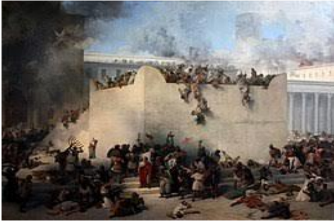
Het einde van Jeruzalem staat vast in 591 v Chr.