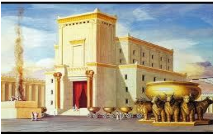
Het huis van God.

zei tegen hen: Verontreinig het huis, vul de voorhoven met gesneuvelden, ga naar buiten. Toen gingen zij naar buiten en zij sloegen toe in de stad. Sommigen commentaren beweren dat God hier de tempel verlaat. Ze wijzen dan op de drempel van de tempel waar de HEERE naar toe ging. Toch kun je je niet aan de indruk onttrekken dat de HEERE troonde op de wolkenwagen vanaf het begin van dit visioen. Het verblijf op de troon van de wolkenwagen – gedragen door de cherubs tot boven de drempel van Gods huis – is niet een teken dat God op dat moment niet in Zijn huis in Jeruzalem aanwezig was. Ook wijst niets er op dat de HEERE op dat moment de tempel verlaat. Vermoedelijk is dat straks wel het geval (Ezechiël 11:22,23) maar nu nog niet. Laat God Ezechiël niet zien hoe er met Zijn heiligheid en heerlijke Aanwezigheid in de tempel in Jeruzalem gespot wordt? Laat God aan de profeet en ook aan ons niet duidelijk merken dat Hij precies op de hoogte is van wat er zich in Zijn nabijheid in de tempel en op het tempelplein in Jeruzalem afspeelt? God heeft Zijn Naam eraan verbonden. God Die alomtegenwoordig is, was – volgens Zijn belofte – hier in de tempel in Jeruzalem op bijzondere wijze aanwezig.