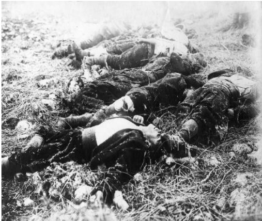
en het gebeurde terwijl ik profeteerde, dat Pelatja stierf.

waarom. Ze storen zich aan God noch gebod. Ze onderdrukken de bevolking. Ze zijn gewelddadig. Maar als de HEERE de daad bij het woord voegt en een van de vooraanstaande mannen sterft, is Ezechiël totaal uit zijn doen. Ezechiël 11:13 En het gebeurde terwijl ik profeteerde, dat Pelatja, de zoon van Benaja, stierf. Toen wierp ik mij met mijn gezicht ter aarde en riep met luide stem: Ach, Heere HEERE, maakt U een vernietigend einde aan het overblijfsel van Israël? Hij is geschokt. Natuurlijk is hij geschokt. Dit is een bekende van hem die vlak voor zijn voeten ineens zijgt en dood voor hem ligt. Ezechiël schrikt zich een hoedje.