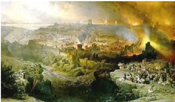
De verwoesting van Jeruzalem.