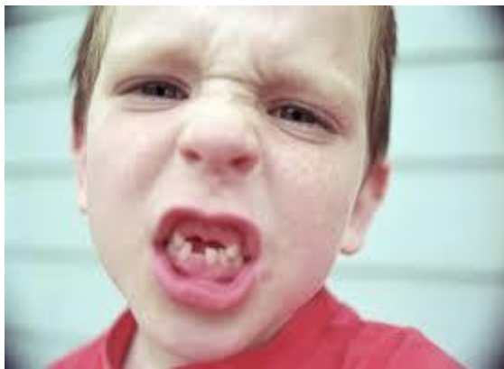
De eigen verantwoordelijkheid van ouders en kinderen.

'Die de misdaad van de vaderen vergeldt aan het derde en het vierde geslacht van het die Mij haten.' Laten we eerlijk zijn het is een van onze onhebbelijkheden om de schuld af te schuiven. 'Ik heb het niet gedaan, maar hij of zij.' Het is – om een voorbeeld te geven – ook voor justitie in Nederland niet zo gemakkelijk om tot een juist vonnis te komen wanneer mensen deel uitmaken van een criminele groep of wanneer de criminele daad samen met anderen gepleegd is. Uitgezocht moet dan worden 'Wie is de dader?' Het is niet zo voor de hand liggend om een hele groep te straffen voor wat een van de leden van die groep heeft gedaan. Dit lijkt ook een van de bijwerkingen van het spreekwoord over 'de vaderen die