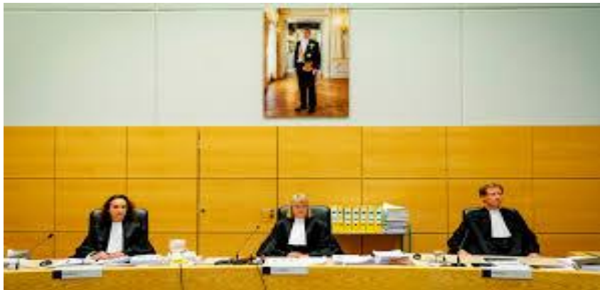
De aanklager aan het woord.

afgemat. Vanaf de voetzool tot het hoofd toe is er geen gezonde plek aan: wonden en striemen en gapende wonden, niet uitgedrukt, niet verbonden, en niet met olie verzacht. Uw land is een woestijn, uw steden zijn met vuur verbrand, uw bouwland – voor uw ogen eten vreemden het op; het is een woestijn, als door vreemden ondersteboven gekeerd. De dochter van Sion is overgebleven als een hutje in een wijngaard, als een nachthutje op een komkommerveld, als een belegerde stad. Is hetzelfde niet van ons land en volk te zeggen? Maar bekering tot God – ook onder christenen – lijkt verder weg dan ooit. Dit weekend hoorde ik nog een kerklid in onze omgeving roepen dat ‘die christelijke regeltjes’ allemaal onzin zijn ‘omdat God genadig is en alles altijd zal vergeven.’ Ik hoor vrijwel niemand zeggen – behalve mijzelf – dat onze God een strenge God is en dat we ons moeten bekeren wil het niet slecht aflopen met ons. Onze God is de Schepper van hemel en aarde en onze Verlosser door de Heere Jezus, Die – toen bleek dat dit nodig was om ons verloren zondaren te redden – bereid was voor ons te sterven aan het kruis. Op die manier verwierf de Heere verzoening van onze schulden en vernieuwing door de Heilige Geest waardoor we een nieuw begin kunnen maken met een nieuwe gezindheid. God de Vader en de Zoon en de Heilige Geest verdient onze gehoorzaamheid en onze toewijding en onze lofprijzing tot in eeuwigheid.