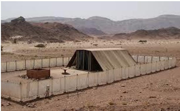
Ohola (= haar tent) en Oholiba (= Mijn tent is daar.)