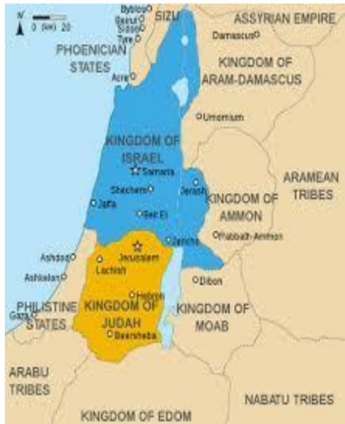
Het Noordrijk Israel en het Zuidrijk Juda.