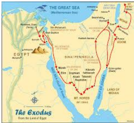
Het land dat Ik Abraham, Izaak en Jakob zou geven.

in het land, Hij of de farao. Het volk Israël stond niet te popelen. Exodus 6:5-8 Zeg daarom tegen de Israëlieten: Ik ben de HEERE. Ik zal u uitleiden van onder de dwangarbeid van de Egyptenaren. Ik zal u redden uit hun slavernij en u verlossen door een uitgestrekte arm en door zware strafgerichten. Ik zal u tot Mijn volk aannemen en Ik zal u tot een God zijn. Dan zult u weten dat Ik de HEERE, uw God, ben, Die u uitleidt van onder de dwangarbeid van de Egyptenaren. Ik zal u brengen in het land waarvoor Ik Mijn hand opgeheven heb, dat Ik het aan Abraham, Izaak en Jakob geven zou. Ik zal het u in erfelijk bezit geven, Ik, de HEERE. Zo sprak Mozes tot de Israëlieten, maar zij luisterden niet naar Mozes door hun moedeloosheid en de harde slavenarbeid.