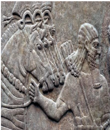
Machthebbers, begerenswaardige jongemannen, die op paarden reden.

Het vervelende was dat de afhankelijkheid van de macht van Assur allerlei afgoden met zich meebracht. Die afgoden doken op in Israël en hoog werden vereerd. Het was overigens niet met tegenzin dat men die goden over de vloer haalde, integendeel. Omdat Assur zo'n grote en sterke macht was stonden hun goden – die daarvoor verantwoordelijk werden gehouden – op een hoog voetstuk. Ezechiël 23:7 Zij richtte haar hoererijen op hen: op heel die keur van Assyriërs. Zij verontreinigde zich met allen op wie zij verliefd was geworden, met al hun stinkgoden . Hoe gaan zulke zaken? Men zoekt steun bij Assur, maar niet zo lang daarna is men toch niet onverdeeld gelukkig met de invloed die Assur uitoefent op de tien stammen van het noorden. Men voelt de druk van Assur. De band die in het begin prettig aanvoelde begon al gauw te knellen. Onbewust kijkt men achterom naar Egypte ook een grootmacht in die tijd. Of