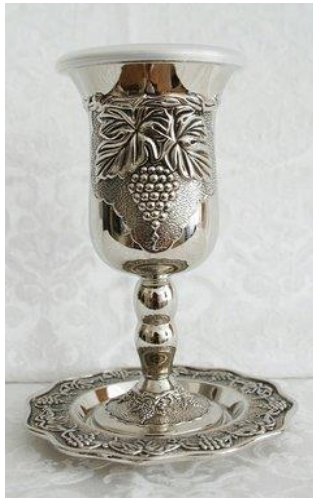
De beker der dankzegging die wij dankzeggende zegenen.