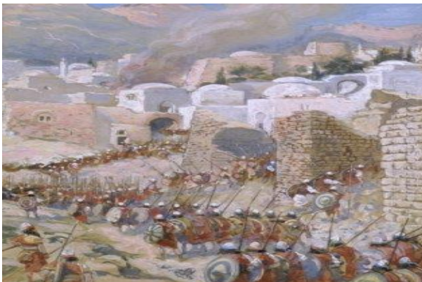
Tyrus wordt een buit voor de volken.

We zijn nog niet vergeten hoe Tyrus reageerde op de ondergang van Jeruzalem. Men wreef zich in de handen. Hoeveel handel – beter gezegd hoeveel geld – zou de handelsstad Tyrus niet toevallen nu een belangrijke concurrent het onderspit delfde. De enige gemoedsgesteldheid die in Tyrus werd aangetroffen was niet leedwezen of deernis maar leedvermaak. Men begroette de vernietiging van Jeruzalem als een persoonlijke overwinning. Tyrus wordt door God niet verworpen door zijn afgodendienst, maar vanwege de god die in die tijd reeds doorbreekt in de godenraad van de volken, namelijk het grote geld. De mammon – zoals de Heere Jezus de god van het geld noemt – waar de wereld uiteindelijk aan kapot zal gaan volgens het boek Openbaring. We luisteren nog even naar het boek Openbaring. Openbaring 18:1-14 En de kooplieden van de aarde zullen over haar huilen en treuren, omdat niemand hun waren meer koopt: koopwaar van goud, zilver, edelgesteente, parels, fijn linnen, purper, zijde en scharlaken, allerlei geurig hout, allerlei ivoren voorwerpen en allerlei voorwerpen van zeer kostbaar hout, koper, ijzer en marmer, en kaneel, reukwerk, mirre, wierook, wijn, olie, meelbloem en tarwe, lastdieren en schapen, paarden en wagens, en lichamen en zielen van mensen. En de rijpe vrucht waarnaar uw ziel verlangde, is van u geweken. Al wat glansrijk en sierlijk was, is van u weggegaan en u zult dat beslist niet meer terugvinden.