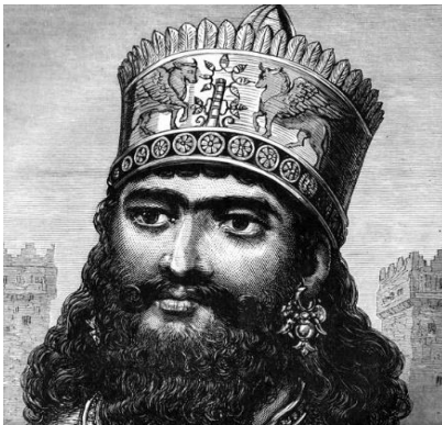
Koning Nebukadnezar van Babel.