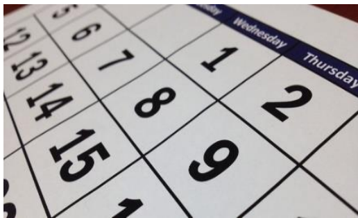
Het gebeurde in het elfde jaar, op de eerste van de maand.

In het twaalfde jaar van de regering van koning Zedekia viel de stad Jeruzalem. Dat lezen we verderop in Ezechiël. Ezechiël 33:21 Het gebeurde in het twaalfde jaar van onze ballingschap, in de tiende maand, op de vijfde van de maand, dat er iemand die uit Jeruzalem ontkomen was, naar mij toe kwam en zei: De stad is verslagen. Tijdens het elfde jaar – waarin dit woord van God tot Ezechiël komt – wordt Jeruzalem belegerd door Nebukadnezar. Ezechiël 26:1 Het gebeurde in het elfde jaar, op de eerste van de maand, dat het woord van de HEERE tot mij kwam.