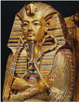
Farao, de koning van Egypte.

Na korte tijd de macht over Israël te hebben uitgeoefend – van 610 - 605 v Chr. – werd Egypte gedwongen zijn vazal af te staan aan het grote en sterke Babel. Dat zat Egypte niet lekker. Egypte heeft vermoedelijk geprobeerd de onderworpen landen tegen de nieuwe overheerser op te zetten, zo ook Juda en Jeruzalem. Er lag namelijk een belofte van Egypte dat zij Jeruzalem en Juda te hulp zouden schieten wanneer Babel zijn tanden zou laten zien. Maar toen het zover was – we schrijven dan 587 v Chr. – en Babel de stad Jeruzalem even liet voor wat het was en een uitval deed naar het zuiden, kroop Egypte weer gauw in zijn schulp. Even later werd het beleg voor Jeruzalem opnieuw geslagen. Aan Egypte heeft Juda helemaal geen steun. Ze beloven gouden bergen maar als het er op aankomt laten ze Israel zitten. Onder meer om die reden moet Ezechiël zich tegen Egypte richten. Ezechiël 29:2 Mensenkind, richt uw blik op de farao, de koning van Egypte, en profeteer tegen hem en tegen heel Egypte. De directe aanleiding voor Gods woede tegen Egypte moeten we echter ergens anders zoeken.