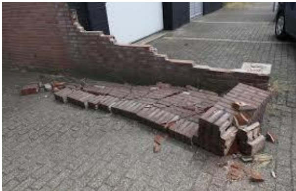
De omgevallen muur