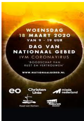
Affiche van gebedsdag in coronatijd.