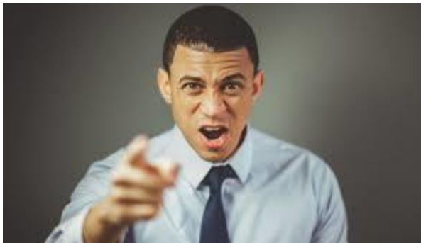
spreken met stemverheffing.