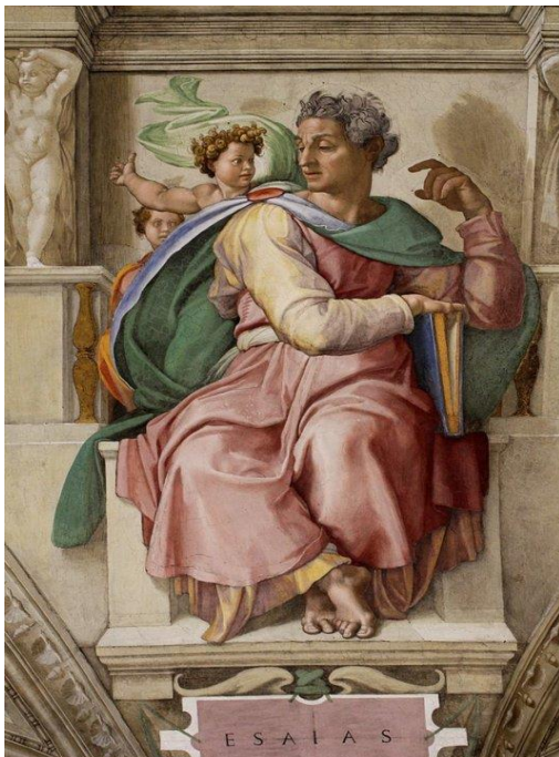
De profeet Jesaja. (Michelangelo)

2 Kronieken 32:32 Het overige nu van de geschiedenis van Hizkia en zijn gunstbewijzen, zie, die zijn beschreven in het visioen van de profeet Jesaja, de zoon van Amoz, en in het boek van de koningen van Juda en Israël.