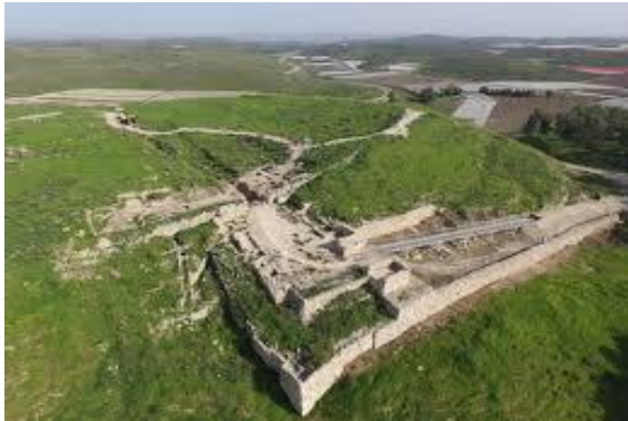
Lachis uit de tijd van Hizkia.

offerhoogten weg, sloeg de gewijde stenen in stukken en hakte de gewijde palen om. Hij verbrijzelde ook de koperen slang, die Mozes gemaakt had, omdat de Israëlieten er tot die tijd toe reukoffers aan gebracht hadden; men noemde hem Nehustan. Hij vertrouwde op de HEERE, de God van Israël, zodat er na hem zijns gelijke niet was onder alle koningen van Juda, en ook niet onder hen die er vóór hem geweest waren. Want hij hield zich vast aan de HEERE; hij week er niet van af Hem na te volgen, en hij nam Zijn geboden in acht, die de HEERE Mozes geboden had. De HEERE was met hem. Overal waarheen hij uittrok, handelde hij verstandig. Bovendien kwam hij in opstand tegen de koning van Assyrië en diende hem niet meer.