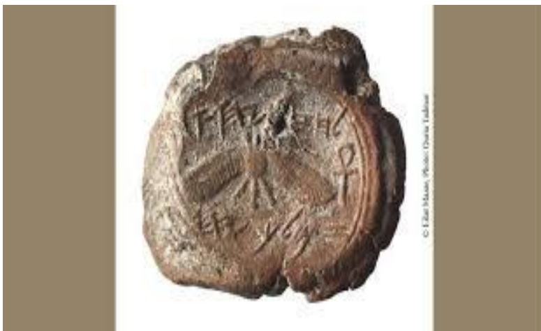
Zegel van koning Hizkia gevonden.