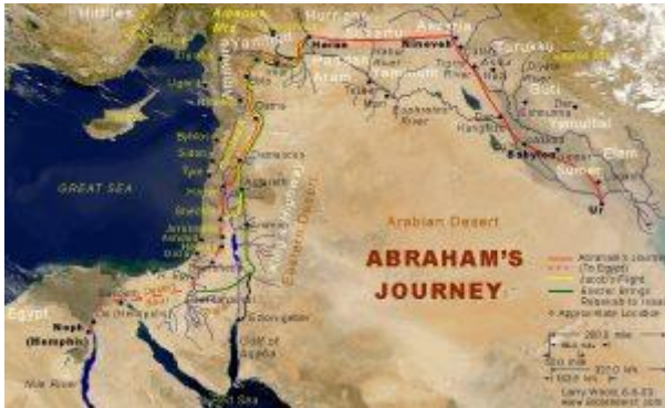
Abraham kwam van Ur der Chaldeeën.