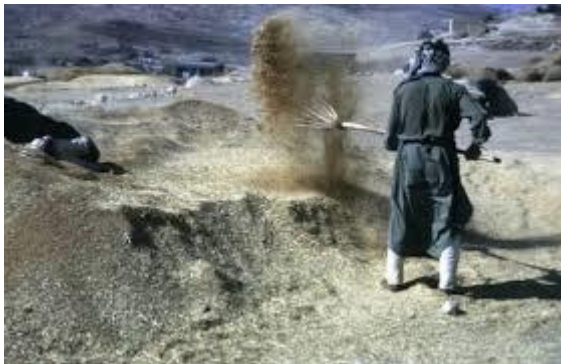
De tarwekorrels vallen neer, het kaf verwaait.

Na alle ontberingen die het volk van God moet doormaken zal er een nieuwe tijd aanbreken.