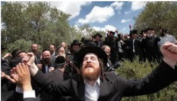
Israël blijft Gods uitverkoren volk.

toekomst kijkt, gaan Zijn gedachten ook terug naar het begin van Zijn bijzondere relatie met Israël. God heeft Abram geroepen van Ur der Chaldeeën, bij wijze van spreken het einde van de aarde. God heeft in Abraham Zich een volk uitverkoren, het volk Israël. Dat moet blijven; die overtuiging bij de Israëlieten om het uitverkoren volk van God te zijn, blijft staan wat de ontwikkelingen in de toekomst ook zullen zijn. Jesaja 41:9 u, die Ik gegrepen heb van de einden der aarde, geroepen uit haar uithoeken, en tegen wie Ik zei: U bent Mijn dienaar, Ik heb u verkozen, Ik heb u niet verworpen. In tegenstelling tot de volken hoeft Israël niet bang te zijn. God is met hen. Ook bij de grote omwenteling van de machten op aarde, zal God Zijn volk – dat zich er midden tussen bevindt – bewaren. God zegt toe Zijn volk op allerlei manieren ter zijde te staan. Op Hem kunnen ze van op aan. Hij is een rechtvaardig God. Als Hij dit toezegt, zal Hij het zeker doen. Jesaja 41:10 Wees niet bevreesd, want Ik ben met u, wees niet verschrikt, want Ik ben uw God. Ik sterk u, ook help Ik u, ook ondersteun Ik u met Mijn rechterhand, die gerechtigheid werkt.