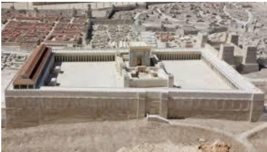
De tweede tempel.

dan tegen je zijn? Dat is waar. Het neemt niet weg dat God ook tegen het volk is geweest. In de tijd van de ballingschap brak alles hen bij de handen af. Wat het volk ook deed om de vijanden buiten de muren te houden, het lukte niet. Die ervaring heeft bij de Joodse gemeenschap afbreuk gedaan aan hun zelfvertrouwen. Toen ook het vertrouwen op God het begaf, was er niet veel van hun zelfgevoel meer over. In het dierenrijk kun je hen misschien vergelijken met een klein worm. Voor God is het bijna een koosnaampje nu Hij Zich tot Schutsheer van Israel heeft opgeworpen. Ze hoeven niet uit te gaan van hun eigen kracht, maar mogen zich verzekerd weten van hulp van boven. God wordt hier Verlosser genoemd. Dat woord komt van het Hebreeuwse woord Go'el, Losser. De Losser koopt een familielid vrij uit de slavernij. Op vergelijkbare wijze bevrijdt de HEERE Zijn volk uit de onderworpenheid aan andere volken op hun grondgebied. God schenkt hen hun eigen land terug en schenkt hen hun waardigheid en vrijheid terug. Jesaja 41:14 Wees niet bevreesd, wormpje Jakob, volkje Israël, Ik help u, spreekt de HEERE, uw Verlosser is de Heilige van Israël.