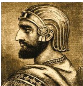
Kores II de Grote, de koning van Perzië 576-530 v Chr.