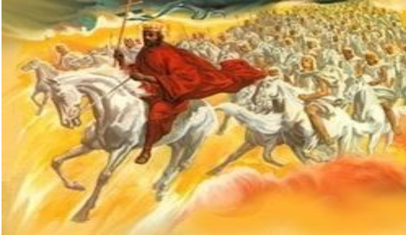
HEERE van de hemelse legers.

schuld of morele schuld. Uiteindelijk betaalt de Heere Jezus onze schuld door Zelf de hoge prijs – van zijn leven – te betalen. Hij is ‘het Lam van God dat de zonde van de wereld wegneemt.’ Johannes 1:29 God beschikt over hemelse legers van engelen. De benaming ‘HEERE van de hemelse legers’ wordt voor het eerst gebruikt in het boek Samuël. God is machtiger dan al onze vijanden bij elkaar. Wie God als Vriend heeft, heeft een machtige bondgenoot ook als het op strijd aankomt. Hij is God. Hij was er altijd en zal er altijd zijn. Jesaja 44:6 Zo zegt de HEERE, de Koning van Israël, zijn Verlosser, de HEERE van de legermachten: Ik ben de Eerste en Ik ben de Laatste, en buiten Mij is er geen God.