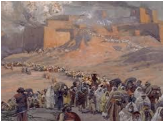
De ballingschap naar Babel.

Voor Israel en – voor alle gelovigen uit de volken die er op dat moment mogelijk zouden komen – is het waardevol om te weten waar het leven van een mens op uitloopt wanneer hij weigert te buigen voor zijn God. Dan wacht het oordeel. Het vonnis van de ballingschap is fysiek en geestelijk een zware straf. Fysiek omdat men alles wat vertrouwd was, kwijt is. Men moet in een totaal nieuwe omgeving een bestaan opbouwen. Deze nieuwe omgeving staat vijandig tegenover de balling en zijn God. De mensen in Babel hebben Mardoek als god, die voor hun gevoel wel bewezen heeft de machtigste god op aarde te zijn. Dat mag dan zo zijn, wacht maar totdat de Perzen de macht van Babel overnemen. Desondanks roept het geloof in andere goden jaloezie op bij de mensen uit Israel. Wat hebben zij dat Israel niet heeft? Het is een periode van beproeving en verzoeking. Om in deze tijd staande te blijven als volk van God wil God Zijn volk troosten . God wil hen diep overtuigen van de rijke traditie waarin zij staan als volk van God. God laat Zijn volk bij wijze van spreken met de trouwfoto nog maar eens zien hoe het allemaal begonnen was tussen God en Israel. Hoe diep en liefdevol de band was tussen Israel en zijn God. En dat de vriendschap met de machtige God en machtige vriendschap is, die veel belovend is voor de toekomst. Over die toekomst wil God het graag met Zijn volk hebben. Hij wil hen enthousiast maken voor de dingen die God van plan is met Israel.