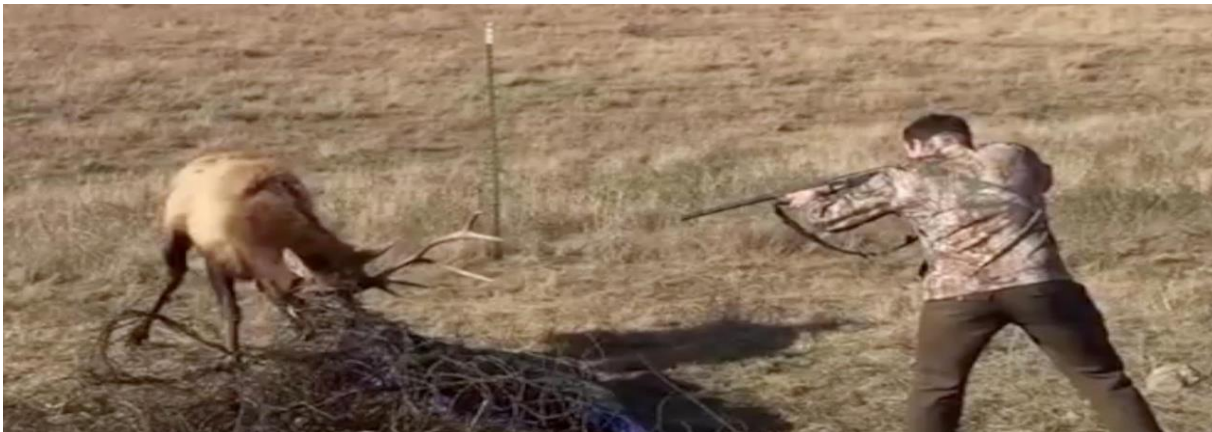
De beker van Gods toorn.