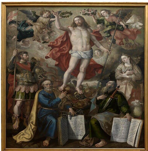
Christus Triomfator (Maerten de Vos 1532)