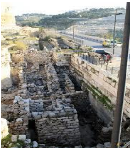
De wederopbouw van de muren van Jeruzalem.

De relatief lange periode die nodig was voor het herstel van tempel en stad, een kleine 100 jaar. Veel van bovenstaande zaken staan beschreven in het boek Ezra. De toestemming van koning Kores en het begin van de tempelbouw. De hernieuwde toestemming van koning Darius en de afbouw van de tempel. Daarna volgt de geschiedenis van Ezra die feitelijk 50 á 70 jaar later opereert. Een lijst van de mensen die Ezra zelf uit de ballingschap mee neemt, volgt later. Ezra 8. Feitelijk is er 100 jaar na dato – behalve de eigen woning en de tempelbouw – nog niet zoveel gebeurd. De muren van de stad zijn nog niet herbouwd. Dat gebeurt pas onder leiding van Nehemia die ook in de tijd van Ezra opereert. Nehemia was schenker aan het hof van dezelfde Perzische vorst Artasasta. Het Joodse