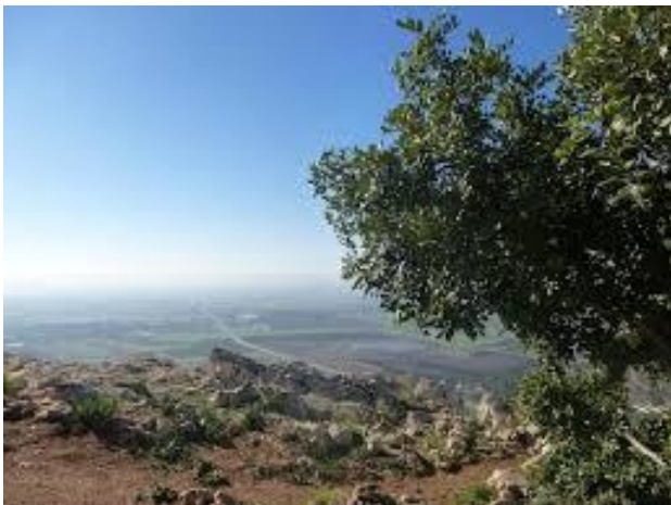
Hoogte met boom in de buurt van Nazareth.

verwerpelijke manier van geloven en leven. Jesaja 57:5 U die gloeit van lust bij de eiken, onder elke bladerrijke boom; u die de kinderen slacht in de beekdalen, onder in de kloven van de rotsen. Blijkbaar gebruikte men grote gladde stenen uit de rivier als offerblok voor de goden. Dat kunnen we opmaken uit 2 Koningen 17:10 Zij hadden gewijde stenen en gewijde palen voor zich opgericht, op elke hoge heuvel en onder elke bladerrijke boom. Het waren de koningen Achaz en Manasse waar het op dit punt helemaal misging. Zelfs kinderoffers – die tot op dat moment vreemd waren aan Israel – werden door hen geïntroduceerd voor de god Moloch. Daar onder die grote boom werd offers gebracht, plengoffers en graanoffers om via de goden die op die plaats vereerd werden de vruchtbaarheid van land en volk en dier te vergroten. Althans dat was de gedachte. Maar God kon er niets mee. Hadden ze soms de bedoeling om God van Israel ter plezieren. Mogelijk is er de suggestie dat de offers ook zijn voor de God van Israel. Maar het tegendeel was het geval. God moet er niets van hebben. Het is afgodendienst. Jesaja 57:6 Bij de gladde stenen van de dalen ligt uw deel, die, die zijn uw lot. Voor hen ook vergiet u een plengoffer, hun brengt u een graanoffer. Zou Ik Mij daarmee laten troosten?