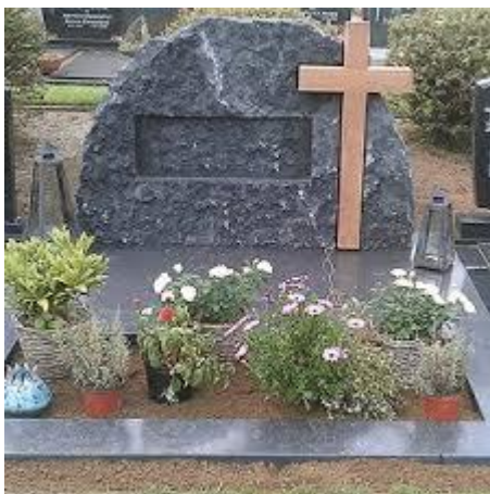
De laatste rustplaats van de gelovige.