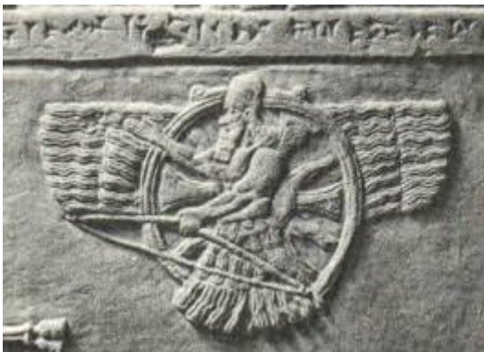
Ashur ,de god van Assur.