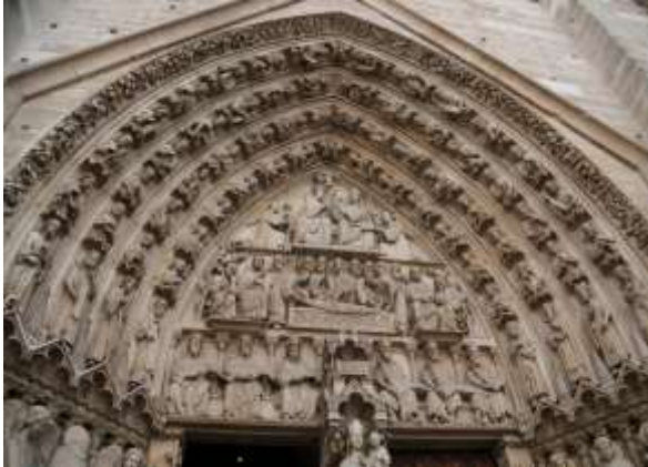
Portaal van het laatste oordeel de Notre Dame.