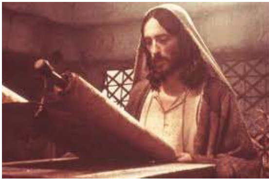
Jezus leest in de synagoge in Nazareth Jesaja 61:1,2a