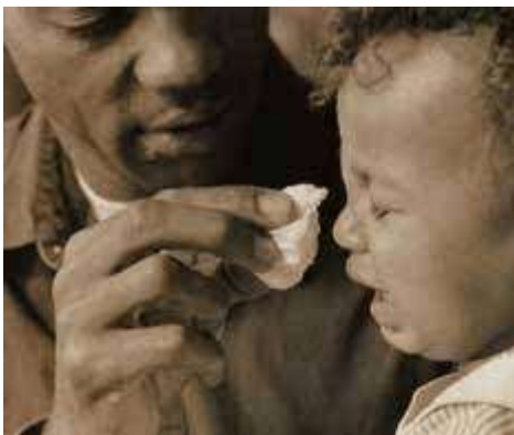
De tranen drogen.