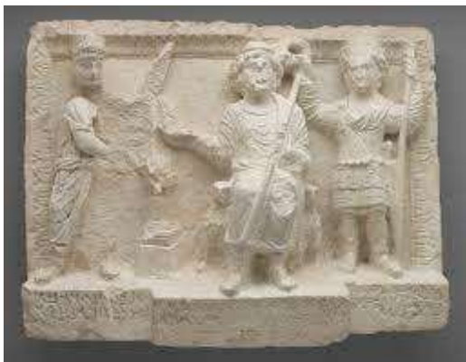
De god Gad, de god van het lot.

hun leven laten bepalen. Daar komt nog bij dat God hen verschillende malen geroepen heeft. Zonder gevolg. De HEERE sprak tot die mensen bij monde van Zijn profeten, maar het haalde niets uit. Waar God op uit is, is niet onduidelijk. De HEERE is niet op zoek naar bepaalde populaire religieuze gebruiken – zoals wierook branden of kaarsen aansteken – maar God is op zoek naar mensen die Hem vertrouwen en gehoorzamen: Mensen die recht doen, die oprecht zijn. Jesaja 65:12 Ik zal u tellen, maar voor het zwaard. U zult allen moeten neerbukken ter slachting, omdat Ik geroepen heb, maar u niet geantwoord hebt, omdat Ik gesproken heb, maar u niet geluisterd hebt, maar gedaan hebt wat slecht was in Mijn ogen, en gekozen hebt voor wat Mij niet behaagt.