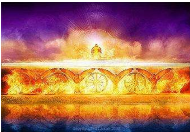
God verschijnt in vuur.