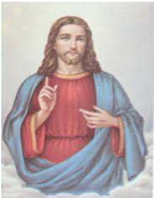
Bij Christus gaan de wegen uiteen; ten dode of ten leven.