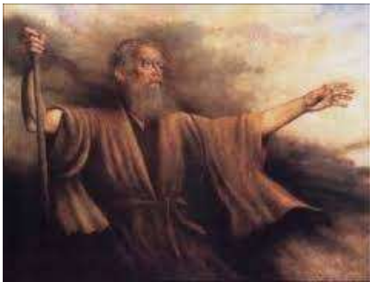
Via de profeten sprak God het volk aan op zijn daden.

Opnieuw zien we een aspect van Gods toe-wending tot de mens om hem te redden: Gods geduld. Wat heeft de HEERE een geduld aan de dag gelegd. Hij sluit een verbond op grond van de tien woorden , maar als het volk een of meer geboden overtreedt komt God niet direct met het vonnis, maar spreekt Hij hen er op aan. Zie staatje. We kunnen gerust alle namen van de profeten naast elkaar zetten als evenzovele voorbeelden van Gods geduld. Via Zijn profeten riep God het volk tot de orde. Van Zijn kant heeft de HEERE er werkelijk alles aan gedaan om het oordeel te voorkomen en Zijn volk te redden, maar het was alsof God voor dovemans oren sprak. Ze luisterden niet. Er veranderde helemaal niets. Het werd alleen maar erger. Er waren uitzonderingen die de regel bevestigen, maar de regel was dat mens God maar liet praten. Uiteindelijk kan het niet anders of dit loopt uit op het oordeel. Jesaja 66:4 Zo zal Ik het loon voor hun handelingen kiezen en zal Ik over hen doen komen wat zij vrezen, omdat Ik riep, maar niemand antwoord gaf, Ik sprak, maar zij niet luisterden. Zij deden wat slecht is in Mijn ogen en zij kozen wat Mij niet behaagt.