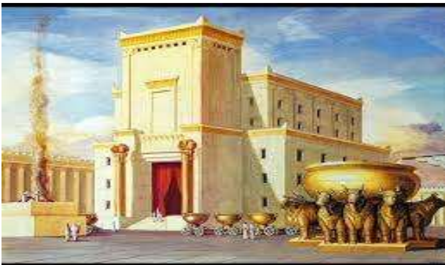
De tempel van Salomo.

Wanneer we daar tegenover zetten de verhoging die de mens aan zichzelf toedenkt – wij wilden als God zijn – dan moeten we ons diep en diep schamen. De zondeval en elke zonde kan gezien worden